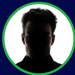
----- ----- WE WORK 14:00-14:40