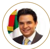
MTRO. ZOÉ ROBLEDO ABURTO

Director General del Instituto Mexicano del Seguro Social