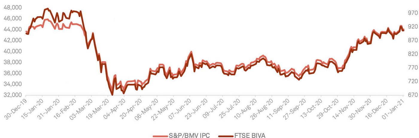
S&amp;P/BMV IPC vs FTSE BIVA