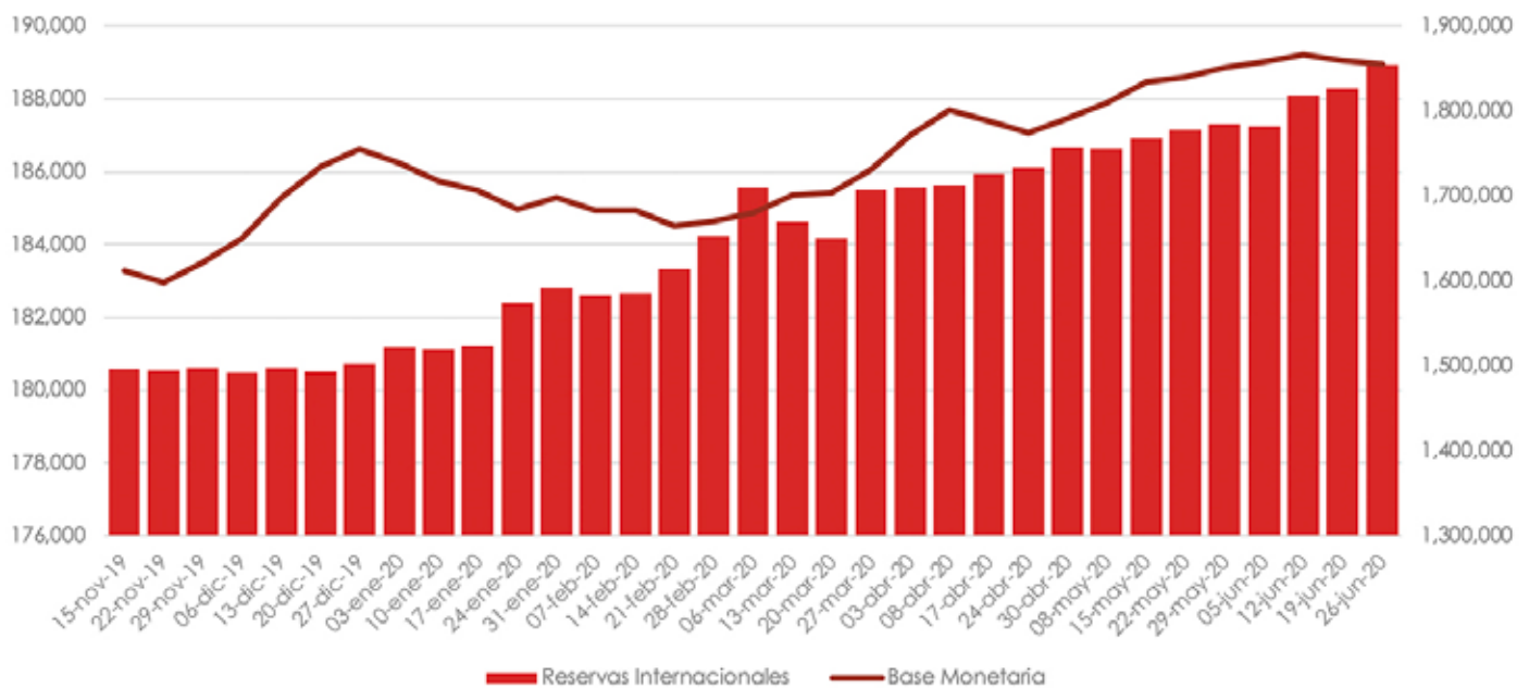
Reservas Internacionales (mdd) vs Base Monetaria (mdp)