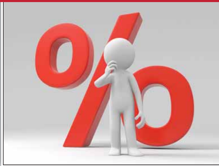
TABLA DE ÍNDICES NACIONALES DE PRECIOS AL CONSUMIDOR (INPC) DE 1950 A ABRIL DE 2013

TASAS DE RECARGOS POR MORA Y POR PRÓRROGA VIGENTES DE 1982 A 2013