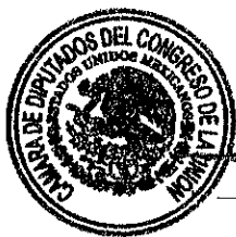
Dip. Ricardo Anaya Cortés Presidente

SALÓN DE SESIONES DE LA CÁMARA DE DIPUTADOS DEL HONORABLE CONGRESO DE LA UNIÓN.- México, D. F., a 18 de octubre de 2013.